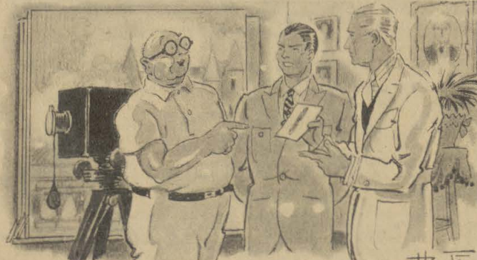
M. Le Boutry était doué d'une parfaite mémoire professionnelle.

— Rassurez-vous ! dit Saint-Clair avec un rire cordial. J'ai par hasard trouvé cette photo dans le guide Michelin de mon fils. Et