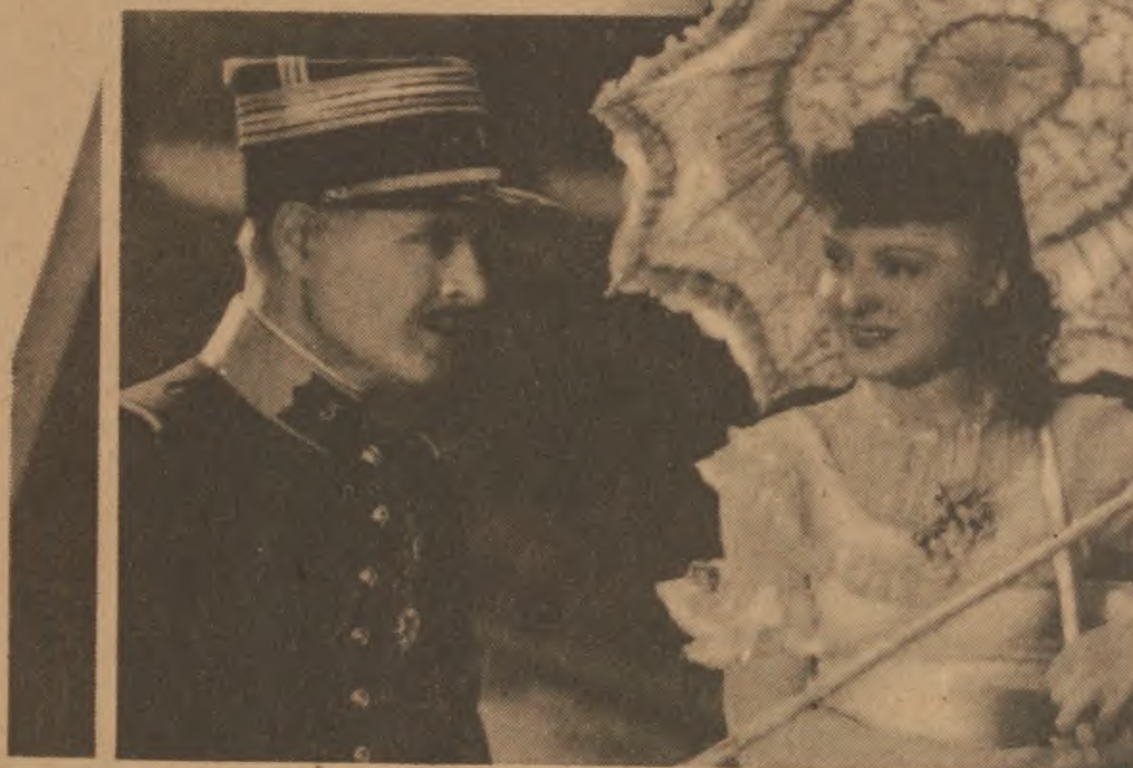
André Luguet et Odette Joyeux dans le « Mariage de Chiffon ».