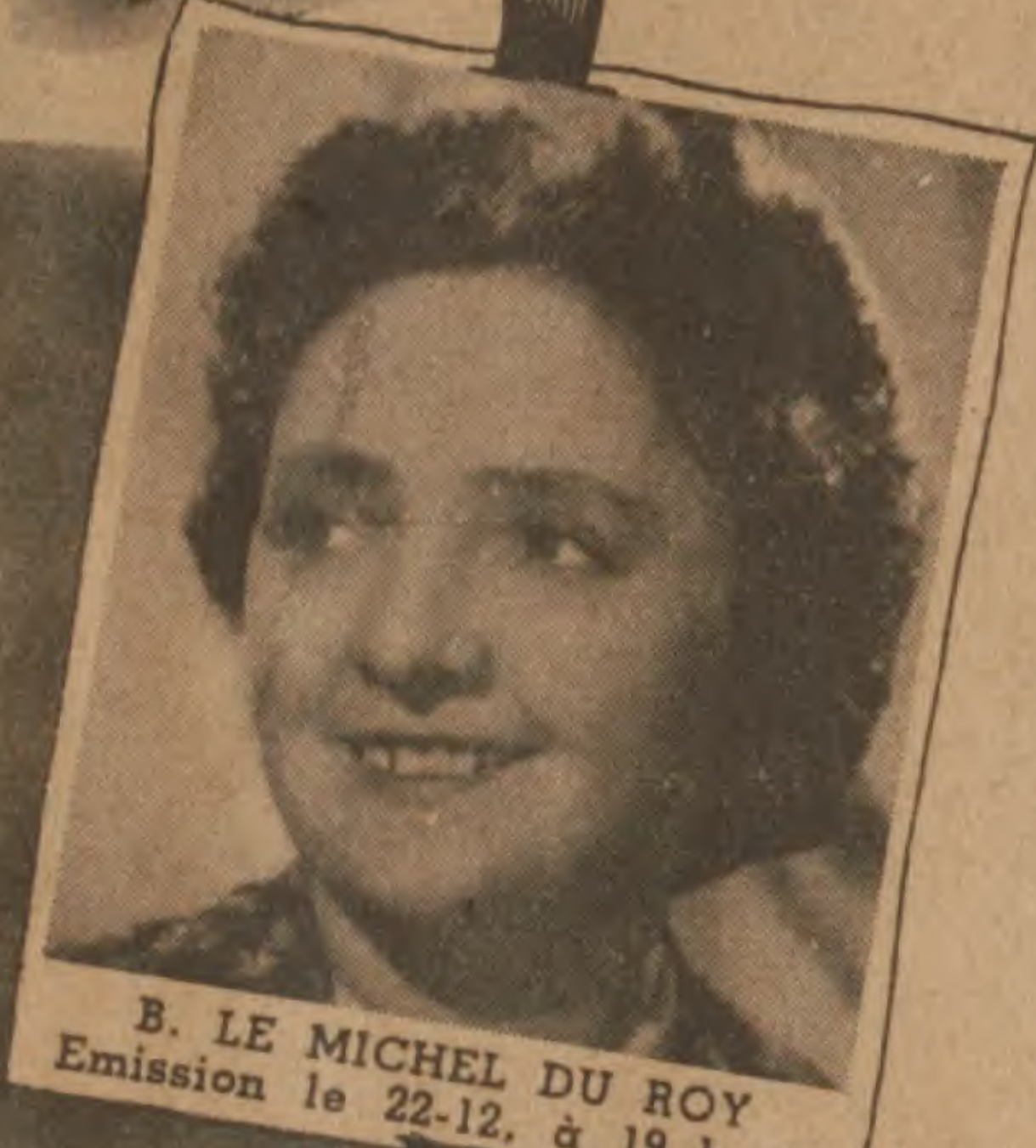
B. LE MICHEL DU ROY Emission le 22-12, à 19 h. 30