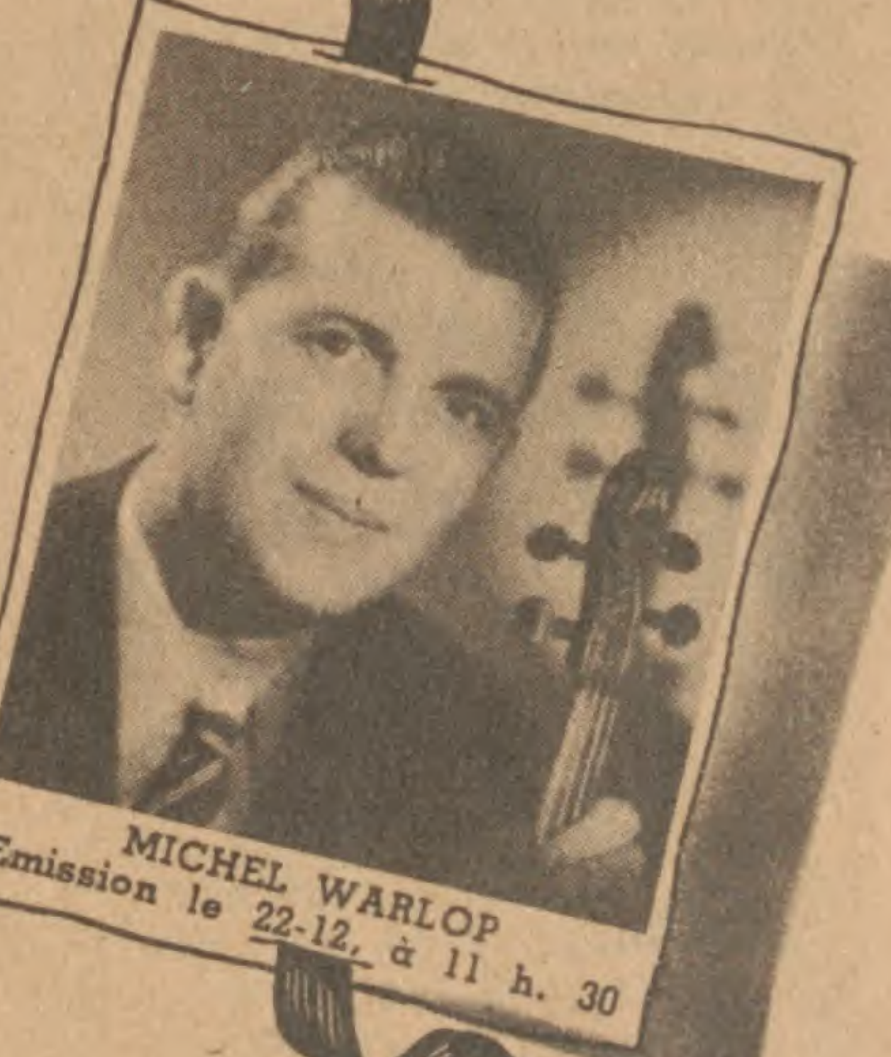
MICHEL WARLOP Emission le 22-12, à 11 h. 30