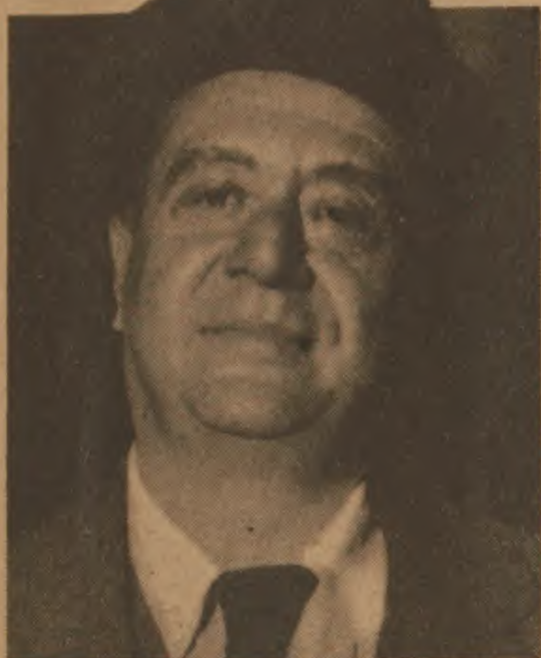
Raimu dans « Le Bienfaiteur », qui sort en exclusivité au « Biarritz ».