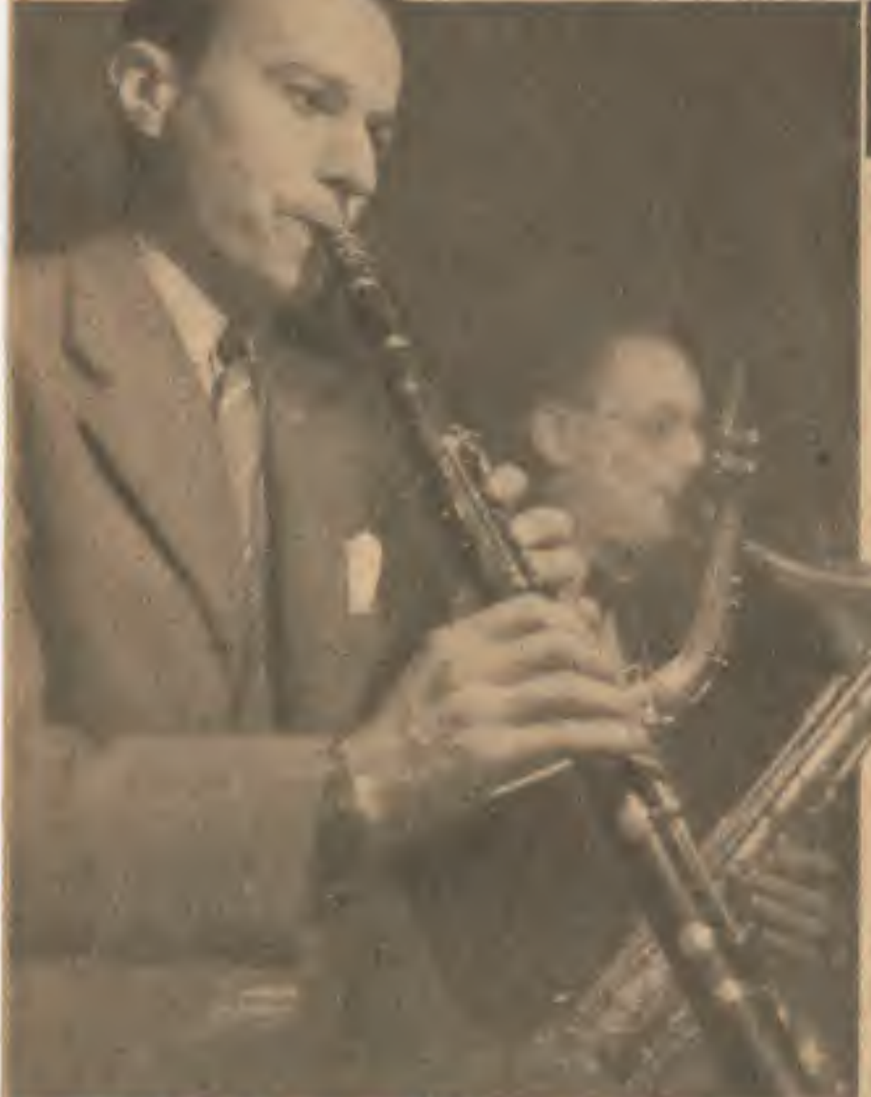
Merchez, un des solistes de l'orchestre.