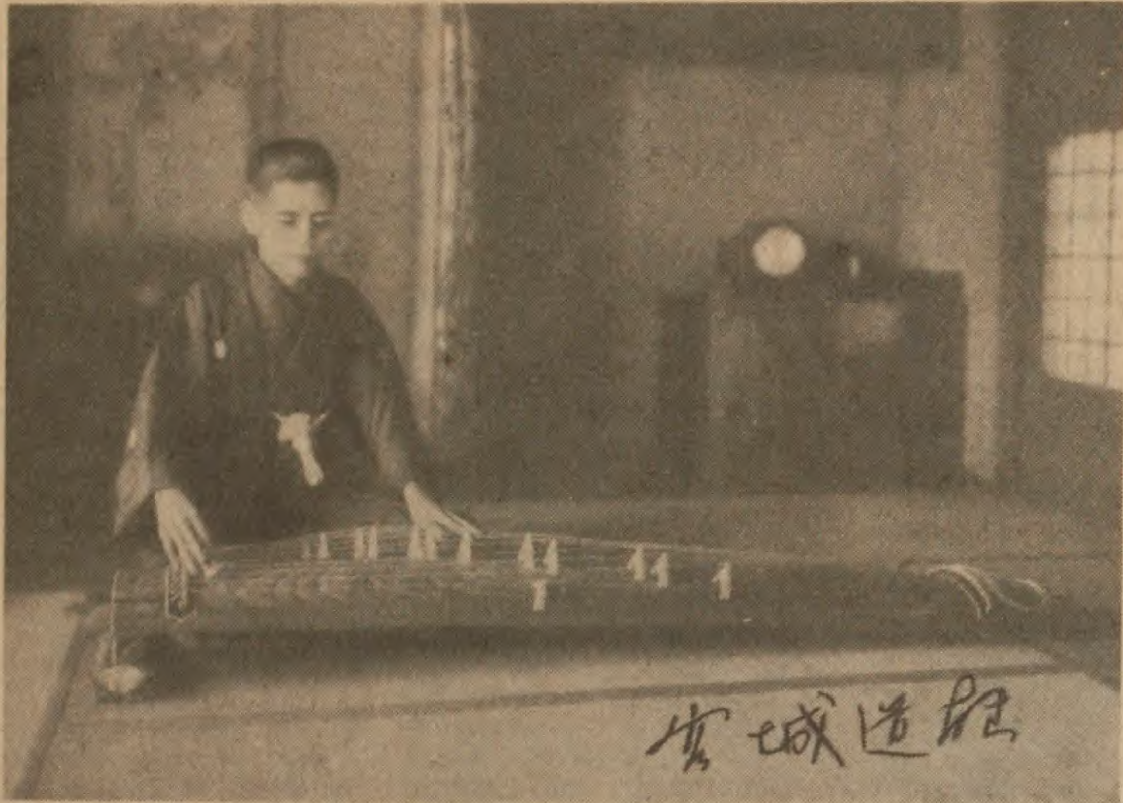
Le compositeur aveugle japonais, Miyagi, dont on pourra entendre les œuvres, le 16 novembre, à 18 heures.