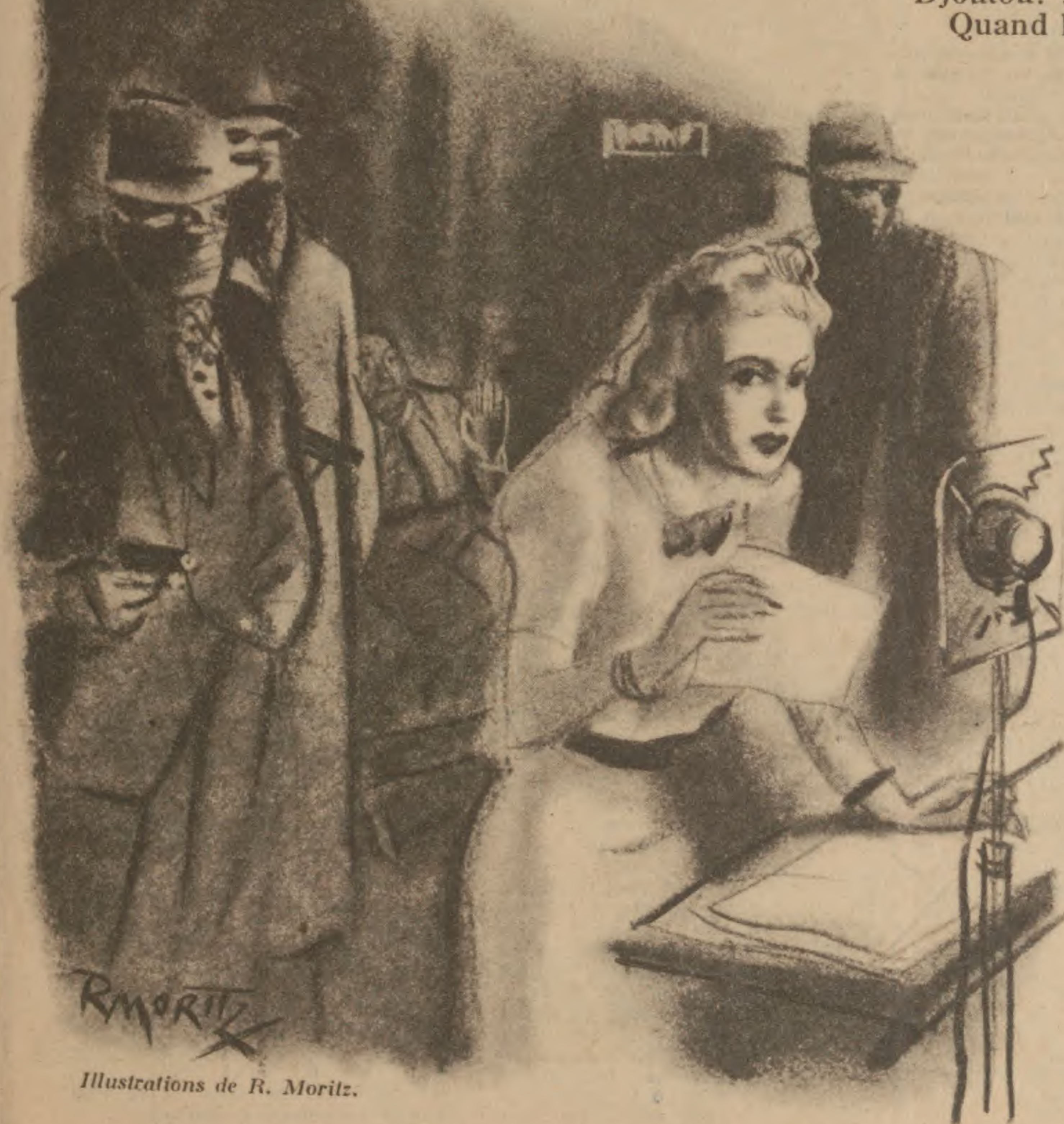
Illustrations de R. Moritz.

— C'est bien simple, répondit la souris blonde. En feignant de trembler, la main sous le manuscrit, je tapotais le micro avec mon crayon... trois coups précipités, trois espacés... trois brèves, trois longues... c'est-à-dire S. O. S. !... S. O. S. !... S. O. S. !... l'appel au secours.