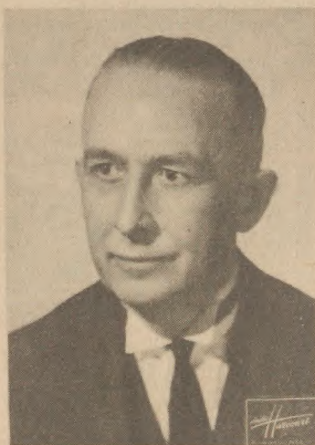
MARCEL DUPRÉ qui jouera à Radio-Paris le samedi 5 septembre à 23 h. 30.