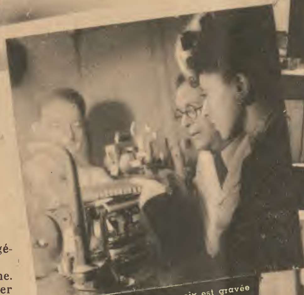
« Alors, vraiment, ma voix est gravée là-dedans ?... »