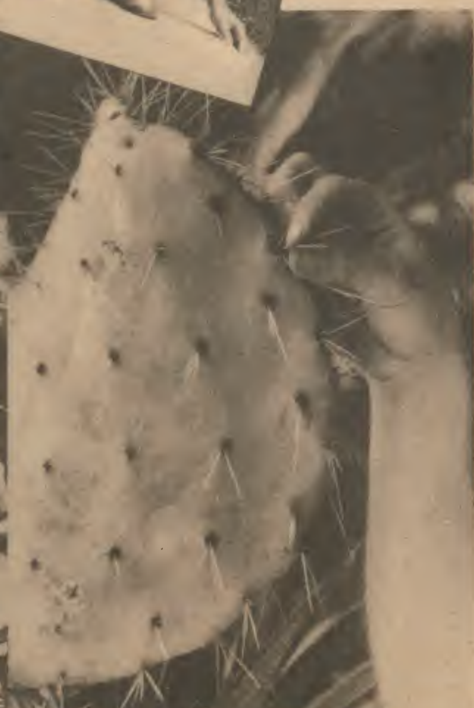
Verrons-nous l'épine du cactus — la vulgaire figue de Barbarie — remplacer les épingles d'acier ? En Algérie, des essais sont faits actuellement dans ce sens.