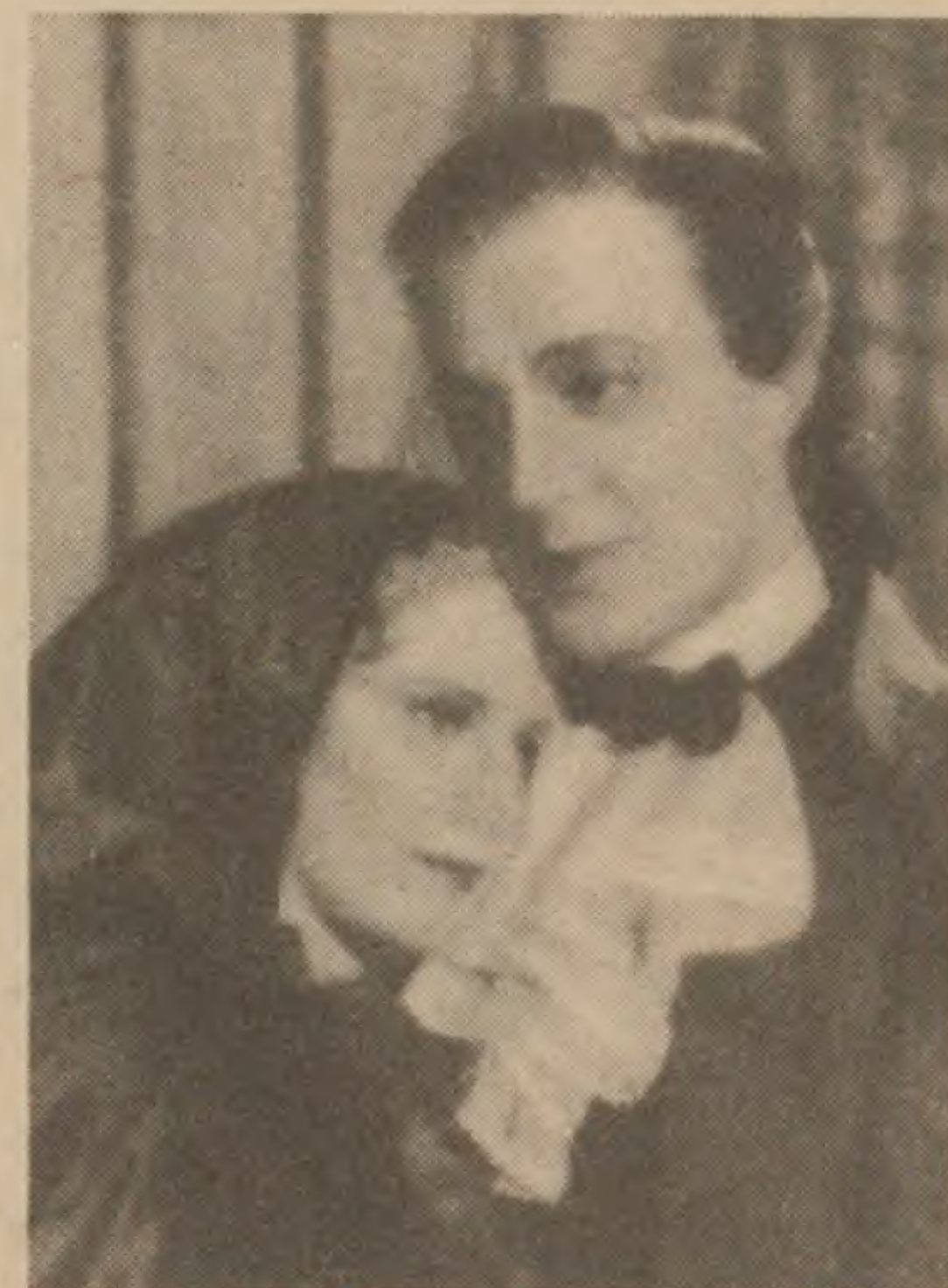
Couple d'hier : Alida Valli et Vittorio de Sica dans « Manon Lescaut...

Au roman de l'abbé Prévost ont été incorporés quelques passages de l'opéra de Puccini chantés par le ténor Benjamino Gigli et Maria Caniglia. Cela, joint à une mise en scène fastueuse, montre le souci qu'ont eu les producteurs de donner à leur film l'ampleur que l'on en attendait. Il serait navrant, après cela, qu'il dût vous décevoir.