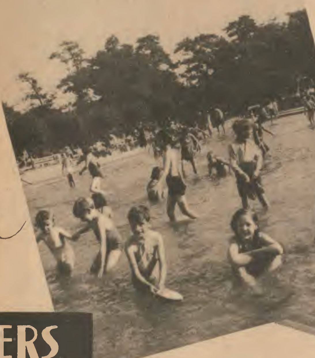
Les piscines de Paris n'ont jamais été aussi encombrées. Mais les enfants ont à leur disposition, dans le Jardin d'Acclimatation, un bassin qui fait leur bonheur par les jours torrides.