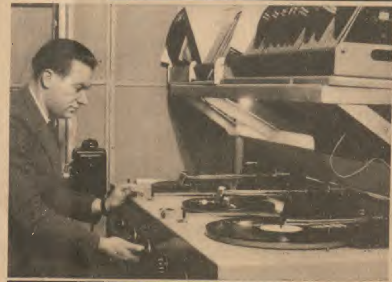
Un opérateur surveille le passage d'un disque sur l'antenne de Radio-Paris.