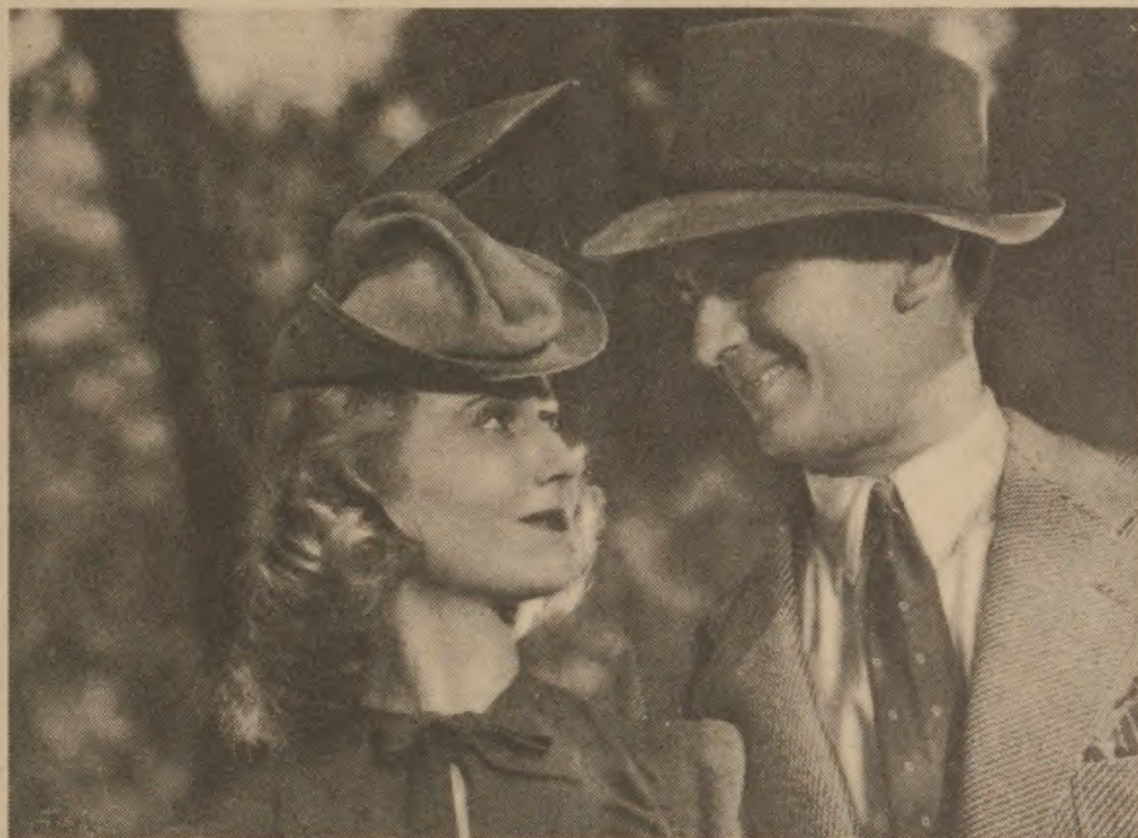
Couple d'aujourd'hui : Renée Faure et Jimmy Gaillard, dans « Le Prince charmant ».