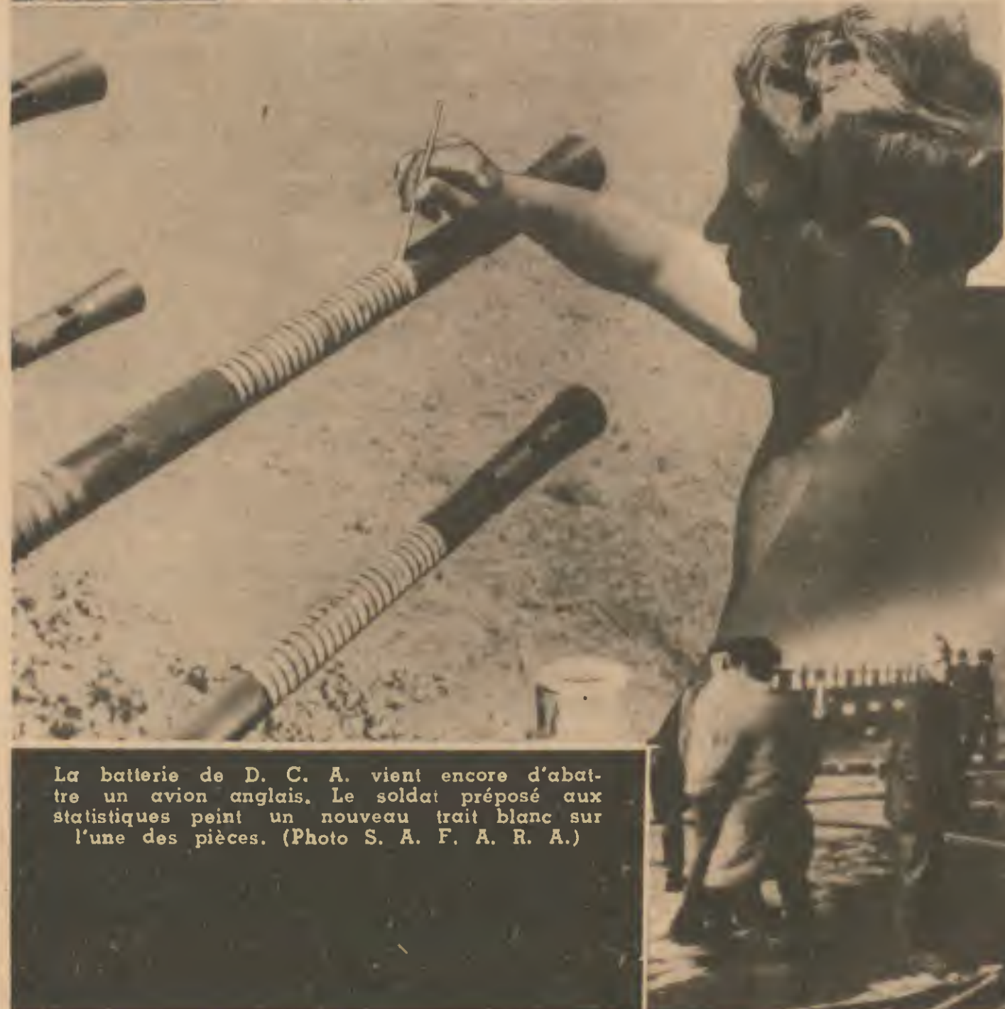
La batterie de D. C. A. vient encore d'abattre un avion anglais. Le soldat préposé aux statistiques peint un nouveau trait blanc sur l'une des pièces.