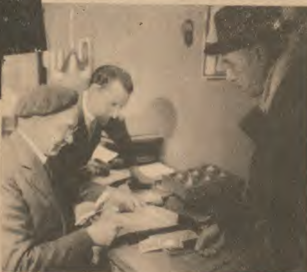
Operation tout particulièrement intéressante : la paie des musiciens.