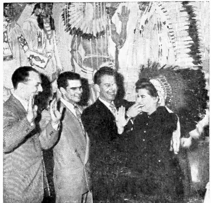
GLORIA DE HAVEN A CHIC - N - COOP