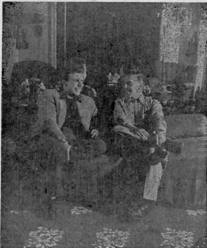
Montréal, le 9 février '52