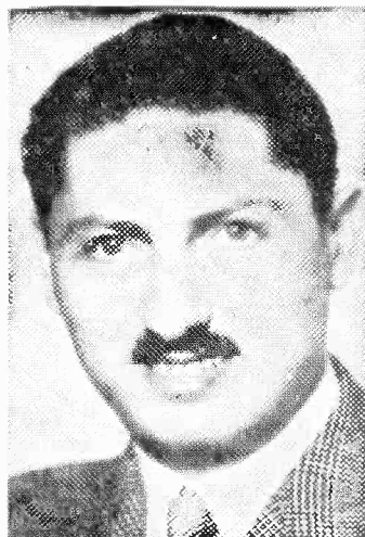
Michel Rostand, peintre français, est actuellement au pays afin d'ajouter à son immense collection quelques uns de nos plus beaux paysages canadiens.