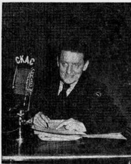
Ernest Pallascio-Morin est l'auteur de L'AUBE INCERTAINE , émission entendue à CKAC et sur les ondes d'un groupe de postes de la province, le mardi soir, à 9h.30. Chaque épisode complet de ce radio-théâtre oppose les conflits les plus divers et des personnages tourmentés par l'existence.