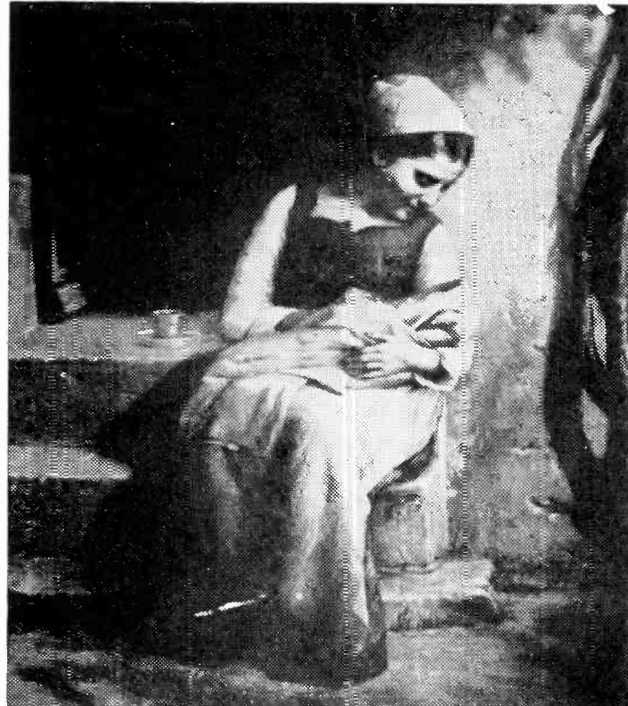
Cette oeuvre de Percy Franklin Woodcock, R.C.A., s'intitule JEUNE MAMAN . Né à Athens, en Ontario, en 1855, ce peintre canadien vécut presque toujours à Montréal et à Paris, où il étudia à l'École des Beaux-Arts, avec Gérôme et Benjamin Constant. Cette peinture est maintenant au Musée de la province.